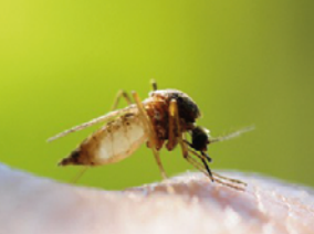
Aedes caspius (rural)