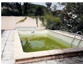
Piscine hors service et bâches de protection