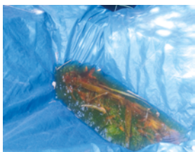
Poches d'eau dans les bâches