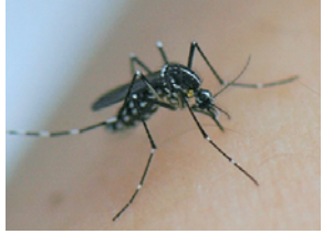
Aedes albopictus/moustique tigre (urbain)