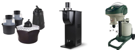
Exemples de pièges à moustiques passifs ou actifs disponibles sur le marché

Il existe de nombreux modèles dans le commerce, les tarifs variant principalement en fonction de leurs rayons d'action. Ils peuvent être passifs ou actifs, avec ou sans aspiration et utilisent des attractifs à base d'imitateurs d'odeurs humaines et/ou de CO2. Leur efficacité dépendra de leur bon positionnement dans le jardin.