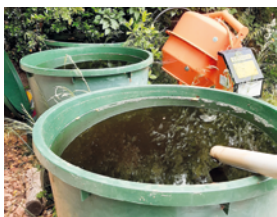
Réserves d'eau non hermétiques