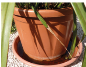
Soucoupes sous les pots