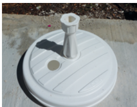
Colonnes et socles de parasol