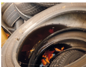
Pneus stockés en extérieur