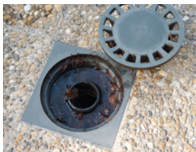
Siphons de sol

Le moustique tigre a un rayon d'action limité de 100 mètres environ autour de son de gîte larvaire. L'élimination des lieux de ponte est donc la méthode la plus efficace contre cet insecte dont 80 % des gîtes se trouvent à l'échelle des jardins. Elle rend inutile le recours à des traitements insecticides chimiques.