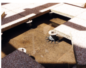
Terrasses sur plots