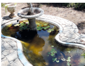
Bassins d'ornement sans poisson