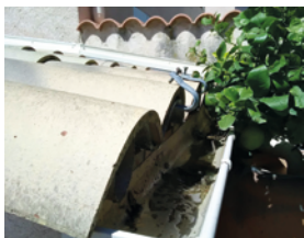
Gouttières bouchées ou en pente inversée