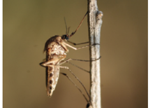
Aedes detritus (rural)

Les adultes, mâles et femelles, se nourrissent du nectar des fleurs et participent ainsi à la pollinisation des plantes, tout comme les abeilles ou les papillons. En revanche, seules les femelles piquent l'Homme ou même, selon les espèces, d'autres animaux, car elles ont besoin de certaines protéines contenues dans le sang pour porter leurs œufs à maturité. Elles pondent chacune jusqu'à 5 fois 200 œufs au cours de leur courte vie (environ 1 mois).