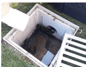
Regards avec bacs de décantation