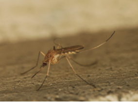
Culex pipiens (urbain)

Le moustique est un insecte qui passe par 4 phases de développement (voir schéma). Dans l'eau, les œufs vont éclore pour donner naissance à des larves dont le mode de vie est exclusivement aquatique. En période estivale, le moustique atteint le stade adulte en une semaine environ. Quelques espèces de moustiques contrôlées par le service LCN.