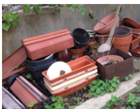
Amoncellements de pots