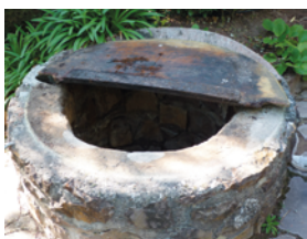
Puits non hermétiques