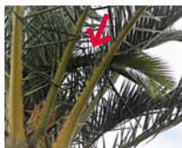
Palmes cassées ou coupées