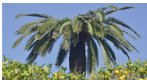
Affaissement de la couronne et absence de palmes centrales