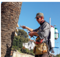
Injection d'un palmier