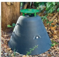
Piège à charançon