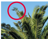
Encoches sur palmiers